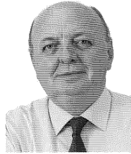
Gilberto Pichetto, viceministro allo Sviluppo economico